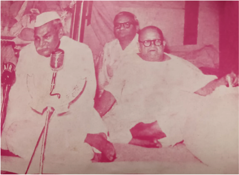
સ્વામીજી અને રાષ્ટ્રપતિ શ્રીરાજેન્દ્રપ્રસાદ