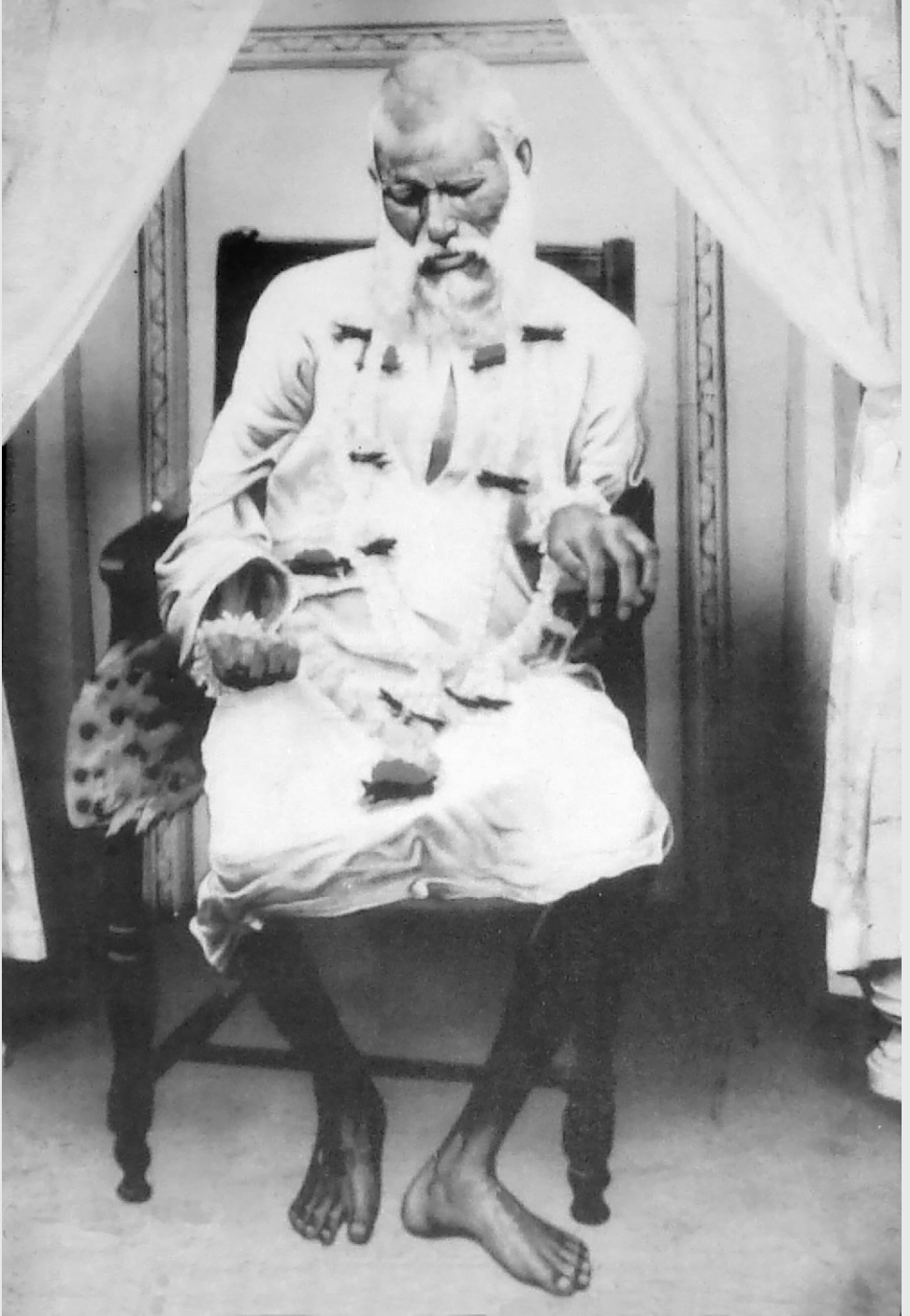
परम पूज्य श्री ताजुद्दीन बाबा