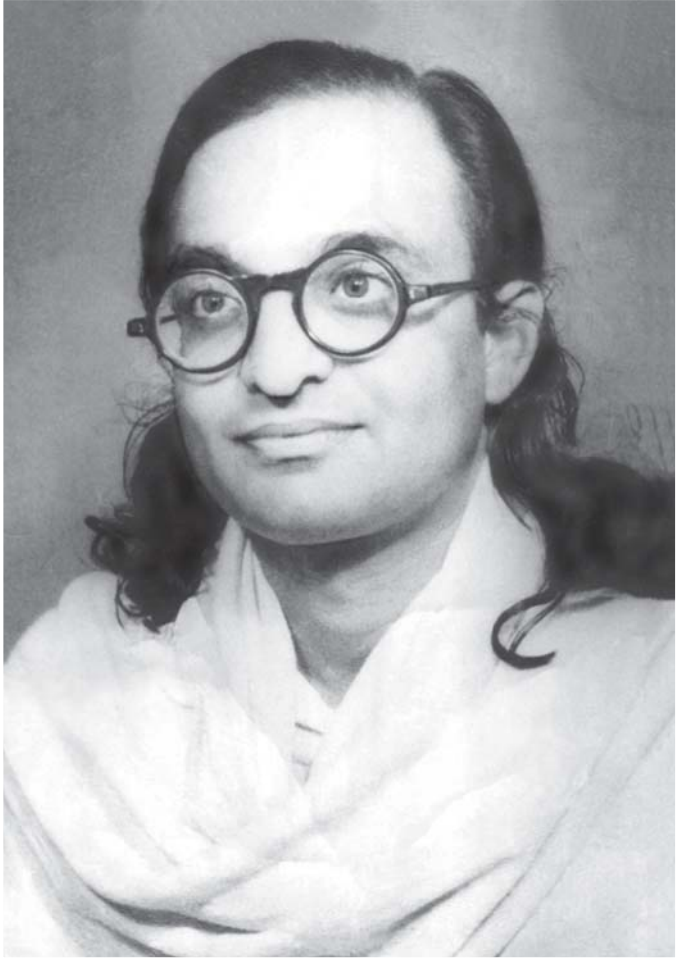
લેખક : શ્રી પ્રતાપભાઈ ઉપાધ્યાય