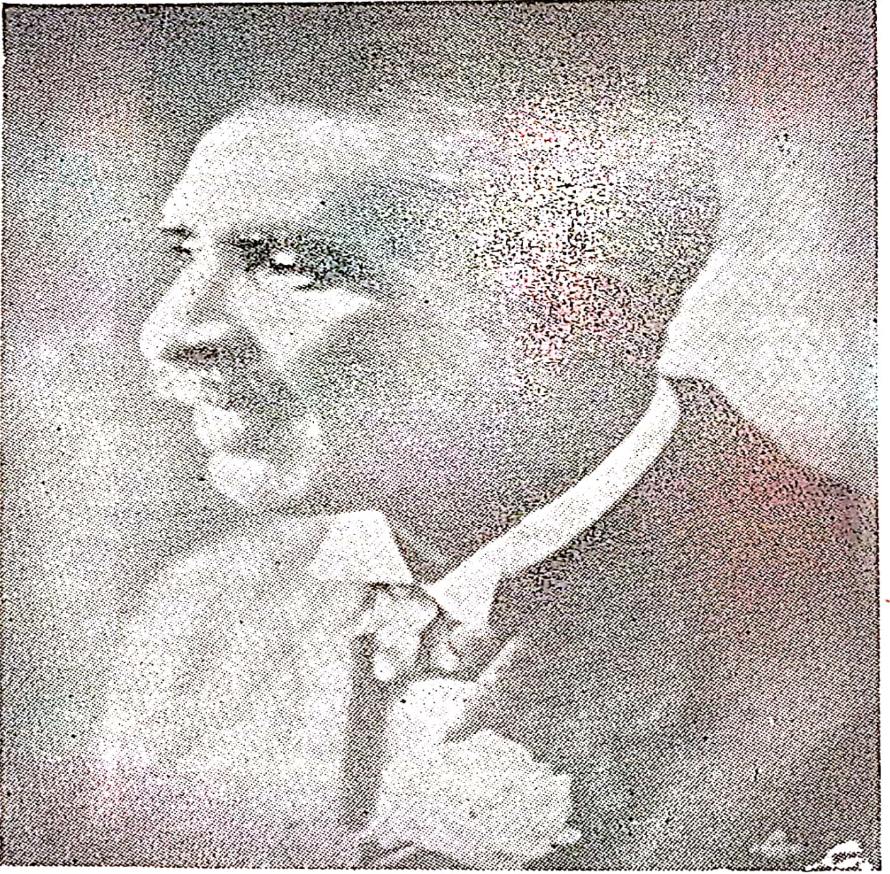
જન્મ ઈ. સ. ૧૮૬૪ ન્યોન વોશિંગ્ટન કાર્વર દેહાંત: ઈ. સ. ૧૯૪૩ (ટસ્કેલ, આલબામા)